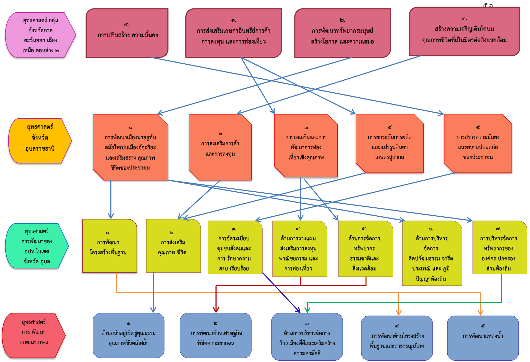
แผนพัฒนาท้องถิ่น (พ.ศ.๒๕๖๖ - ๒๕๗๐) องค์การบริหารส่วนตำบลนาเกษม